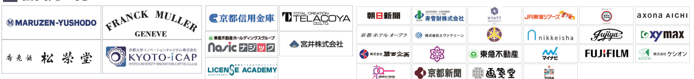
京都アカデミアフォーラム in 丸の内 新丸の内ビルディング10F